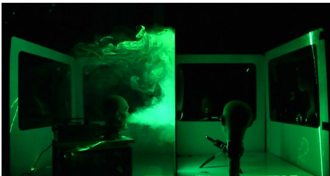
Die Nachtaufnahme zeigt besonders deutlich, wie der Nebel von der Trennwand abprallt.